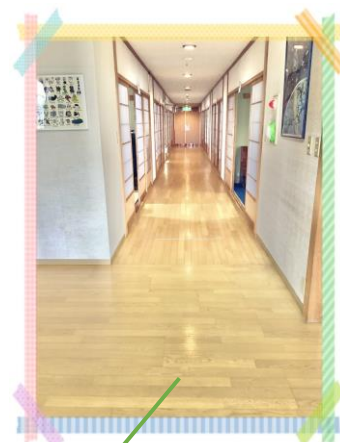
かけっこもできる 長〜い廊下