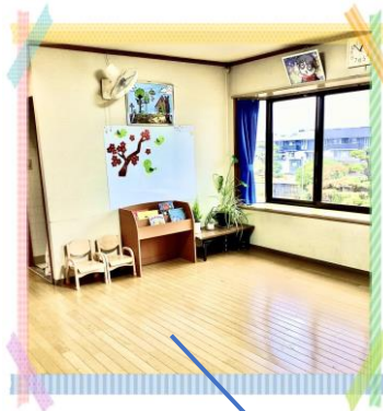
階段を上ると 広いホール