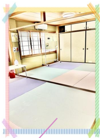
かわいいカラー豊 の療育ルーム

サポートするスタッフ同士がしっかりとコミュニケーションを図り、明るく楽しい環境を整えて、お子様が安心して、にこにこ笑顔で過ごせる場所を提供します。