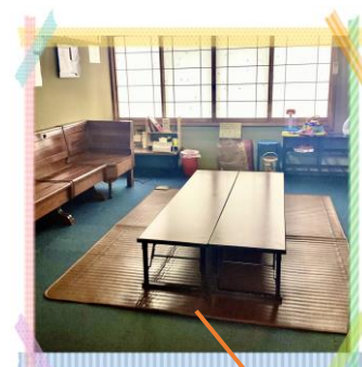
保護者様の くつろぎルーム