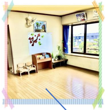
階段を上ると広いホール