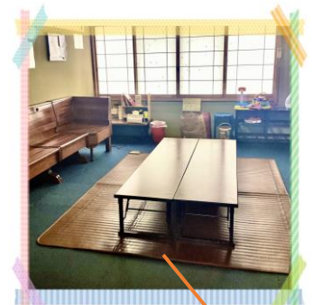
保護者様のくつろぎルーム